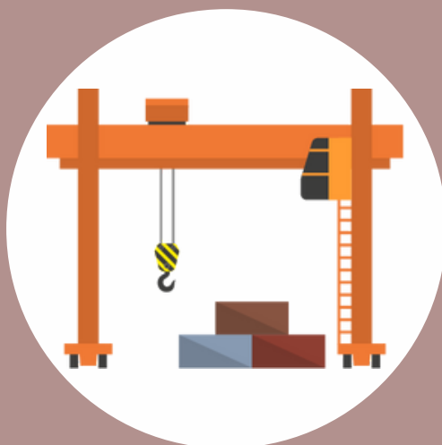
R484 CAT A